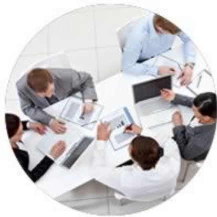
Comités de Dirección y Consejos de Administración

towinCoach está dirigido al corazón de cualquier organización, sea cual sea el tamaño o área, actuando principalmente con: