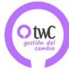
towinCoach Gestión del cambio