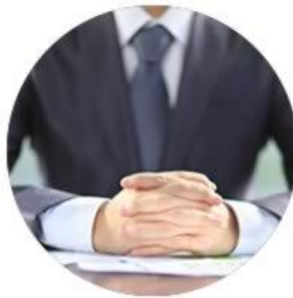
Presidentes y Consejeros